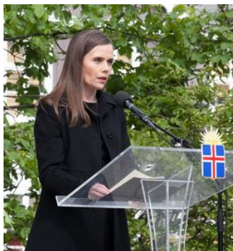
Katrín, le 17 juin

Commençons par la première d'entre elles : Katrín Jakobsdóttir, Première Ministre, se dit satisfaite de la coopération gouvernementale. Bien sur, dit-elle, cette coopération n'a pas la même signification pour les membres de son parti et ceux du Parti de l'Indépendance. Elle rappelle un sondage à propos des spectacles préférés des uns et des autres « Les derniers (Parti de l'Indépendance) veulent assister à une comédie qui les fera sourire pendant tout le spectacle, là où les premiers (Gauche Verte) attendent du spectacle qu'il leur donne mauvaise conscience et les engage dans le changement. » L'interview a lieu le 6 juin au sortir du Comité de Sécurité qu'elle préside, et qui est en charge d'un sujet à propos duquel les positions des deux partis sont diamétralement opposées.