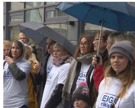
« Eign rikísins » = propriété de l'État

Femmes encore : les sages-femmes sont engagées depuis plusieurs mois dans un conflit de plus en plus dur. Un premier accord signé le 1 er juin entre leurs représentantes et le ministère de la santé, et prévoyant une augmentation de 4.2% de leurs salaires et la promesse d'une somme de 60 millions d'Ikr (480000 €) à gérer par leurs organismes a été récusé par 70% des votantes (participation au vote électronique : 87% !). On est loin en effet de leur revendication de parité salariale avec des professions exigeant le même niveau d'études (médecins, juristes...). Simultanément 23 des sages-femmes travaillant à l'Hôpital Central ont annoncé leur démission avec une prise d'effet étalée jusque octobre. De plus une consultation est organisée sur la grève des heures supplémentaires : 90% votent pour avec une participation de 77.6%.