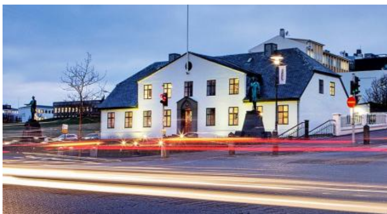
les bureaux de la Première Ministre

Peut-être avais je tort de croire et écrire que la seule ambition du gouvernement dirigé par Katrín Jakobsdóttir serait de durer, ambition déjà élevée compte tenu de l'instabilité antérieure et de la composition du nouvel Alþingi. Me semblaient escamotés tous projets susceptibles de diviser la nouvelle coalition, dont la réforme constitutionnelle, citée très brièvement comme pour mémoire dans l'accord de gouvernement. Or voici que la Première Ministre distribue le 22 janvier aux huit partis représentés à l'Alþingi une feuille de