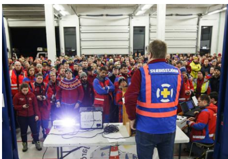
consignes aux volontaires

Une immense compassion saisit toute l'Islande dès les premières heures : oubliés le gouvernement, les pêcheurs en grève et les handballeurs, Birna est devenue la fille de toutes les mères, de tous les pères, l'amie de tous les adolescents. Des centaines de volontaires se mobilisent pour la chercher. La police communique en permanence sur ce qu'elle trouve ou ne trouve pas. Elle sera par contre beaucoup plus discrète sur les interrogatoires des deux marins groenlandais suspectés d'avoir enlevé Birna : aucun nom, aucun visage, conformément à la loi islandaise.