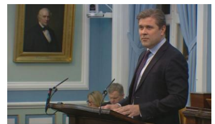
Bjarni à la tribune de l'Alþingi

Bjarni Benediktsson, nouveau Premier Ministre, bien sur, défend son programme : un accroissement sans précédent des dépenses sociales, permis par la qualité de ce que le gouvernement a reçu en héritage 3 .